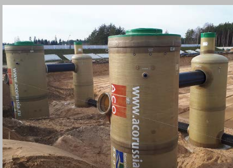
Индустриальный парк "Великий камень" "Оборудование для очистки поверхностного стока в составе ЛОС накопительного типа с самым большим в мире безбетонным аккумулярующим резервуаром АСО StormBrixx, Минск, Республика Беларусь